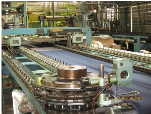
仕上げの巾出しを行います