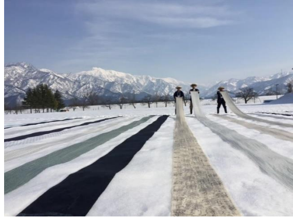
晴天時に上布を雪にさらします